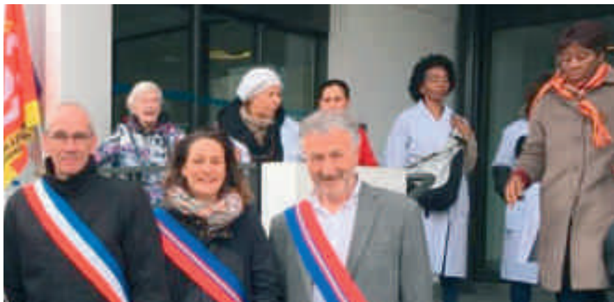
Sur le terrain, avec vous pour défendre le droit à la santé, ici devant l'hôpital de Villeneuve