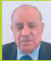
Salman El Herfi Ambassadeur de Palestine à Paris

” Elsa Faucillon sera votre voix à l'Assemblée nationale pour défendre le partage des richesses et des pouvoirs. Nous avons besoin de sa sincérité et de son énergie pour relancer l'idéal de progrès humain. ■