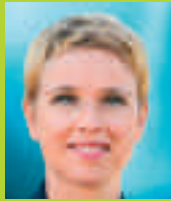
Clémentine Autain Conseillère régionale

” Elsa Faucillon sera votre voix à l'Assemblée nationale pour défendre le partage des richesses et des pouvoirs. Nous avons besoin de sa sincérité et de son énergie pour relancer l'idéal de progrès humain. ■