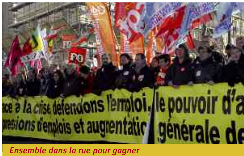
Ensemble dans la rue pour gagner

dire nous tous. Un « nous tous », qui représente la majorité de la population, un « nous tous » qui prendra de la force le jour où il se rendra compte qu'il est « nous tous » et s'exprimera uni dans les urnes comme dans la rue.